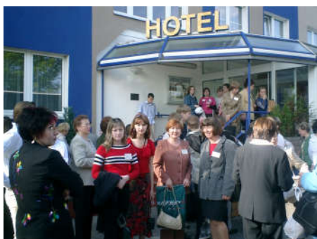
Германо-Российский Форум. Подписан договор о сотрудничестве с гимназией г. Шлезвиг.