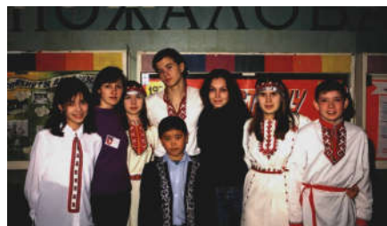
Форум интернационалистов в г. Волгограде