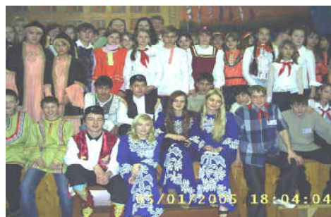
Первый фестиваль дружбы в г. Йошкар-Ола